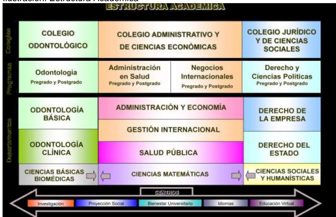
Ilustración: Estructura Académica

Buscando aumentar la interdisciplinariedad en el currículo, La Institución Universitaria Colegios de Colombia, se apoya e interactúa en varias asignaturas y diversos espacios académicos con el Colegio Administrativo y de Ciencias Económicas en los Departamentos de Salud Pública, Administración y Economía y con el Colegio Jurídico y de Ciencias Sociales en el Departamento de Ciencias Sociales y Humanístico.