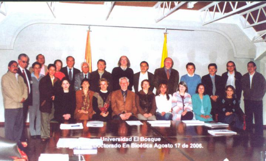
Universidad El Bosque Inauguración del Doctorado En Bioética Agosto 17 de 2006.